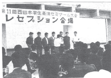
大会実行委員会役員紹介

全員がご健在です。このような大偉業の達成は、経済学部での旧制山口高商時代からの、伝統的な力強い底力の發揮によるものとも言えるでしょう。