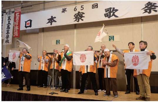
鳳陽寮寮歌を高唱

第65回日本寮歌祭が令和7年11月23日、東京・日暮里のホテルで開催された。北海道から九州まで全国の大学の同窓生が参加。鳳陽会東京支部の有志は伝統の山口高商の旗を掲げ、鳳陽寮寮歌を熱唱した。