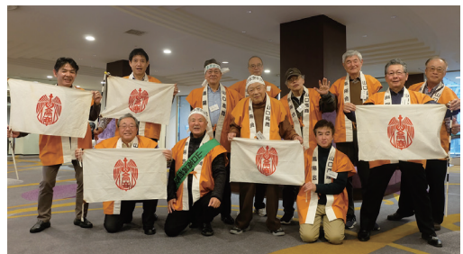
日本寮歌祭に参加した東京支部の有志