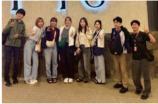
留学に参加した8名

8月から9月にかけてのフィリピンセブ島での英語特訓留学は、今回はわずか8名の参加となりましたが、皆元気に頑張つて帰国いたしました。参加したすべての学生が、「一生でこれ程楽しく勉強できたことはない!」と口々に感謝の言葉を述べていました。皆様