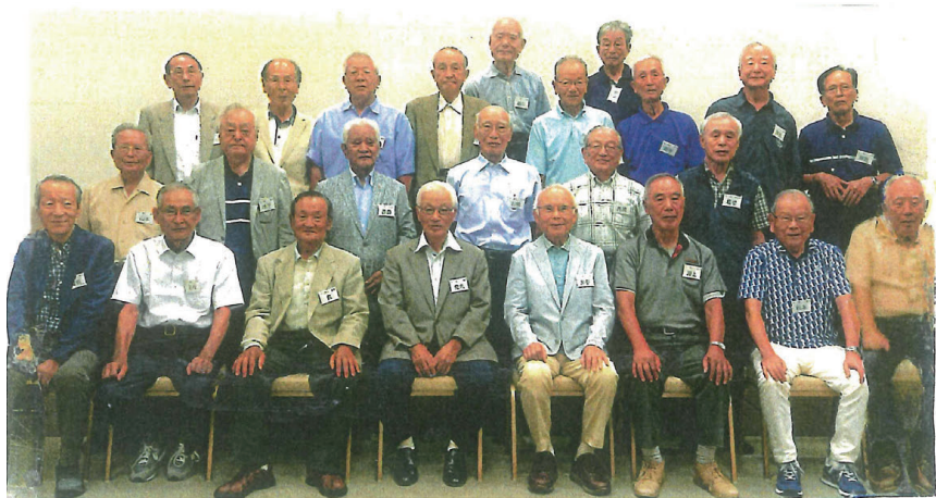
山口大学鳳陽寮OB会 令和7年9月19日(金) 12・13・14期 於：山口市湯田温泉「セントコア山口」